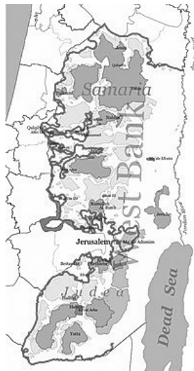
Figura 2. Mapa de Cisjordania con el trazado del Muro en rojo (julio de 2006)