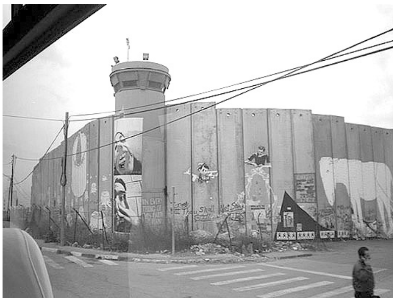
Otra fotografía del Muro.