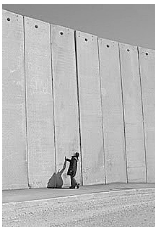
Fotografía de una sección del "Muro de la Vergüenza"