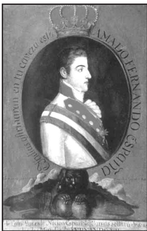
Anónimo, Imagen de Jura con retrato de Fernando VII (ca. 1800), Museo Regional de Guadalajara, México.