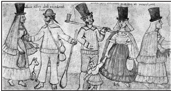
1. Agricultores y campesinos del Cartago colonial. Dibujo coloreado contenido en el Álbum de Figueroa. Archivo Nacional de Costa Rica (ANCR), Álbum de Figueroa (ca. 1850 – 1900).

Si bien la Corona española estableció en sus colonias de ultramar un sistema de clases altamente jerarquizado, las festividades religiosas y civiles ofrecían una suerte de democratización al permitir la participación de la sociedad en pleno; de hecho, las autoridades coloniales favorecieron la escenificación teatral como una forma de diversión accesible a todos por igual 3 .