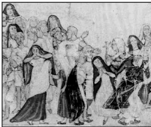
3. Representación dramática en el Cartago colonial. Dibujo coloreado contenido en el Álbum de Figueroa . Archivo Nacional de Costa Rica (ANCR), Álbum de Figueroa (ca. 1850 – 1900).

Después de los nutridos aplausos del público a la loa (la más breve de las tres obras, pues se compone de 334 versos), se presentó un satírico entremés, cuyos personajes son las cuatro virtudes cardinales (Prudencia, Justicia, Fortaleza y Templanza), que hacen de jueces; un muñeco combustible de paja personificando a Napoleón Bonaparte, un verdugo llamado Siclaco, y el Diablo que viene por el monigote. En esta segunda pieza, de 769 versos, también se colma de hiperbólicas alabanzas al rey don Fernando VII y de vituperios a Bonaparte, y se quema la efigie del segundo, ante el férvido entusiasmo y aplausos del público que desbordaba la Plaza Mayor de Cartago, convertida literalmente en un teatro. En concordancia con lo anterior, en uno de los versos se decía: “Así como arde este fuego/ ardan los nobles vasallos/ en amor y digan todos/ Viva nuestro Rey Fernando”.